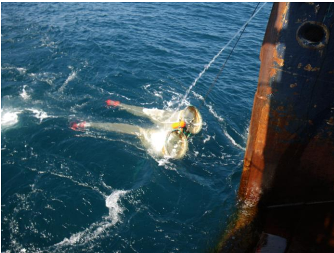
Prøvarnir til at kanna rognkorn hjá makreli verða tiknar við einum fínmeskaðum glúpi (Bongo). Glúpurin verður tóvaður niður á 200m og uppافتur. Ein sensor var festur á rammuna, so man alla tíðina kundi fylgja við, á hvörjum dýpi útgerðin var.